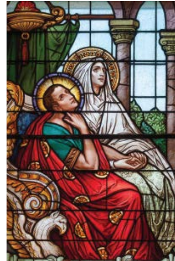
Santa Mónica y San Agustín

después de lo cual Agustín tomó una copia de las cartas de San Pablo y leyó Romanos 13,14-15, siendo esta lectura lo que sirvió como catalizador para llevar a nuestro famoso hijo pródigo de regreso a casa, a la Fe.